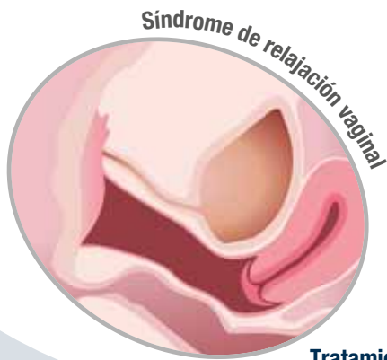
Síndrome de relajación vaginal