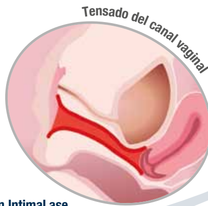
Tensado del canal vaginal